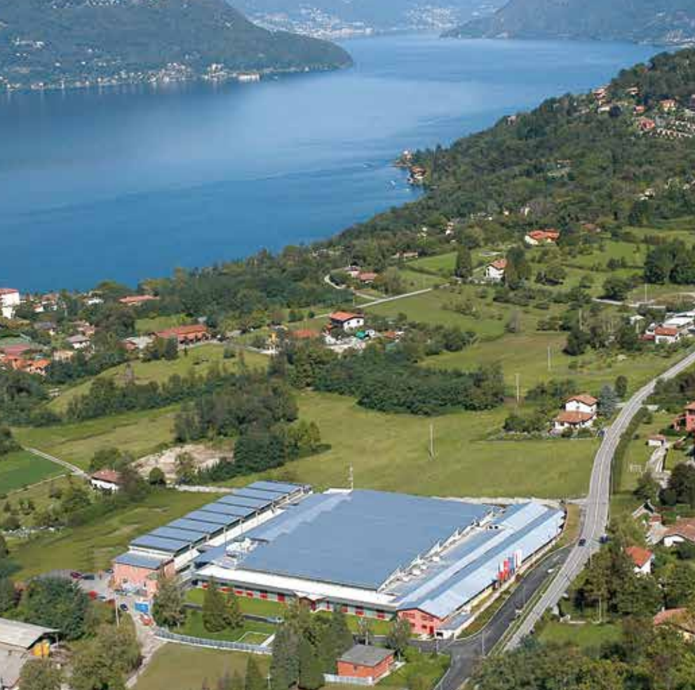
Il sito produttivo di Brezzo di Bedero (VA) Brezzo di Bedero (Varese, Italy) production site